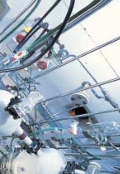
Vorbehandlung: Horst Dieter Botzet kontrolliert den Fällungsprozess, mit dem Kunststoffe elektrisch leitfähig gemacht werden.