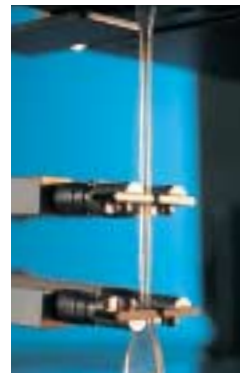
Zugfestigkeit: Joachim Peckhaus prüft die Qualität des Kunststoffteils vor dem Versuch.

Katalysatoren demnächst einsetzen. Ein Teil der molekularen Tausendsassas soll aber durchaus auch in Lizenz an andere Firmen vergeben werden. Welche Möglichkeiten in den D/A-Metallocenen stecken, lässt sich heute nur erahnen. Schon die erste Metallocen-Revolution der Katalysatoren hatte weit reichende Folgen für die praktische Anwendung. Inzwischen gibt es Polyethylene, die kugelsicher und zugleich strapazierfähiger sind als Schutzwesten aus herkömmlichen Carbonfasern. Ein weiterer Vorteil der neuen Katalysatoren: Sie erfordern bei der Produktion